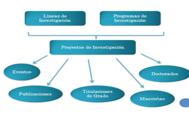
Figura 1. Concepción del proceso de gestión de la investigación. Universidad Metropolitana del Ecuador.

Se parte del objetivo estratégico planteado por la UMET:...el desarrollo de la investigación a partir de líneas pertinentes, programas y proyectos que contribuyan al desarrollo nacional y zonal en el ámbito del Plan Nacional del Buen Vivir. A partir de este se definen sus líneas, programas y proyectos de investigación, los cuales son la fuente fundamental para la obtención de los resultados de investigación (República del Ecuador. Universidad Metropolitana, 2015c).