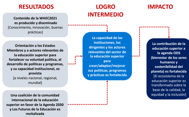
Figura 1. WHEC2021: Fortaleciendo la contribución de la educación superior a la agenda ODS y más allá

La WHEC2021 se centrará en tres resultados clave: 1) producción y difusión de conocimiento, innovación y buenas prácticas; 2) orientación a los Estados Miembros de la UNESCO y a los actores clave del sector de la educación superior para fortalecer su voluntad política, el desarrollo de políticas y programas y el fortalecimiento de capacidades; 3) revitalización de una coalición dentro de la comunidad de educación superior para alcanzar los objetivos de la Agenda 2030 y Los futuros de la Educación. Se espera que estos tres productos refuercen la capacidad (logro) de las instituciones, los líderes y demás actores clave del sector de la educación superior, a fin de que estos puedan crear, adaptar y/o mejorar sus programas.